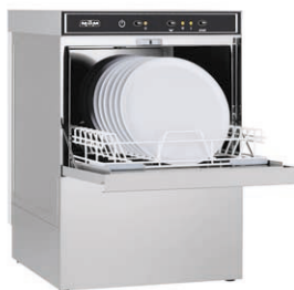
LS 505 M